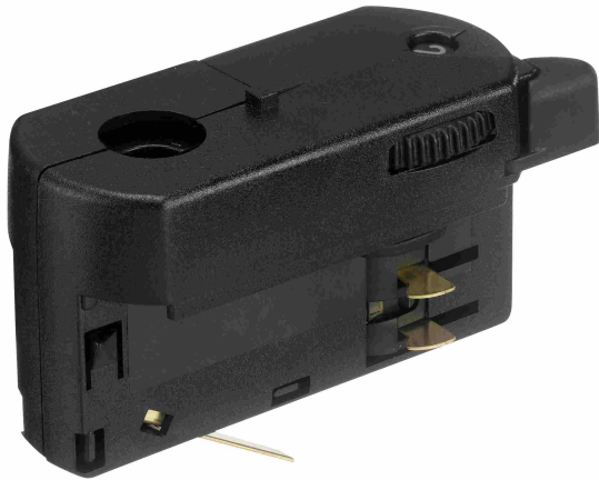
GA 69 1.40 mm 2.14 mm 3.70 mm 4.32 mm